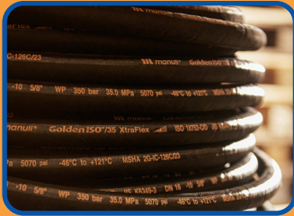
Enrolladores de manguera