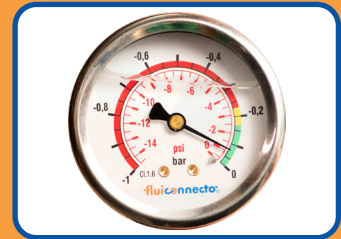
Otras herramientas y accesorios