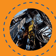
Petróleo y Gas