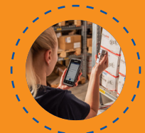
Manejo de Materiales y Logística